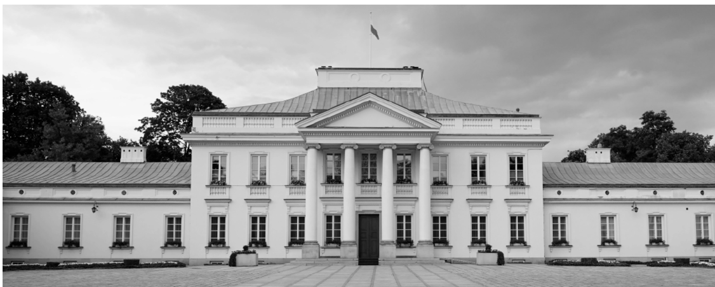
Belweder w Warszawie